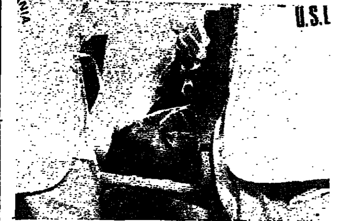
حارس مرمرى الأرجنتيني يوميديو على الحيلة بعد اصطافه بكسر في ساقه اليمنى

ضمن المهام الاسياني ماغولو تخصيص جزء من المدرجات للتشجيع على كأس العالم بلخضاره فرقة آلات تخصية الى ايطاليا وتضم الفرقة مقيمين متحسين للشوول لاعب فريق اتلتيكو مدريد وقد امكن مشاهدتها والاهم من ذلك سماعها بالاستاد الفناء مباراة اسبانيا واوروغواي. قال جوزيف ميكرسيغر مدرب المنتخب ان لا بد من تخصيص مكان لكل مباراة في كأس العالم عام ١٩٩٤ التي تقام بالولايات المتحدة. وقال للمصنفين ان كأس العالم الحالية اظهرت صعوبة تحكيم مباراة حدية.